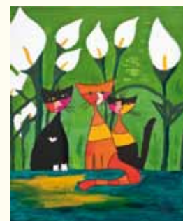
Gatos Matilde Leal – 12 anos