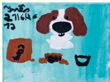
Mimos Inês Grave – 6 anos