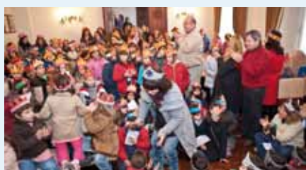
As Escolas no Salão Nobre