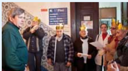
Utentes da Misericórdia no Município