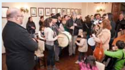
Receção no Salão Nobre com o GETAS

Mau grado não ter havido, este ano, Cantares de Reis em Alcaravela e Santiago de Montalegre, devido à crise económica e à indisponibilidade pessoal de alguns elementos-chave para garantir a vertente musical, em Sardoal e Valhascos a tradição cumpriu-se. Os utentes da Misericórdia e os alunos das Escolas (em 5 e 7 de janeiro) deslocaram-se ao Município, desejando Bom Ano aos responsáveis autárquicos. No dia 6 foi levado a efeito, pelo GETAS, o IX Encontro de Cantadores de Reis, com receção no Salão Nobre dos Paços do Concelho e exibição no Centro Cultural. Neste Encontro participaram cantadores de Sardoal, Alcaravela e Valhascos.