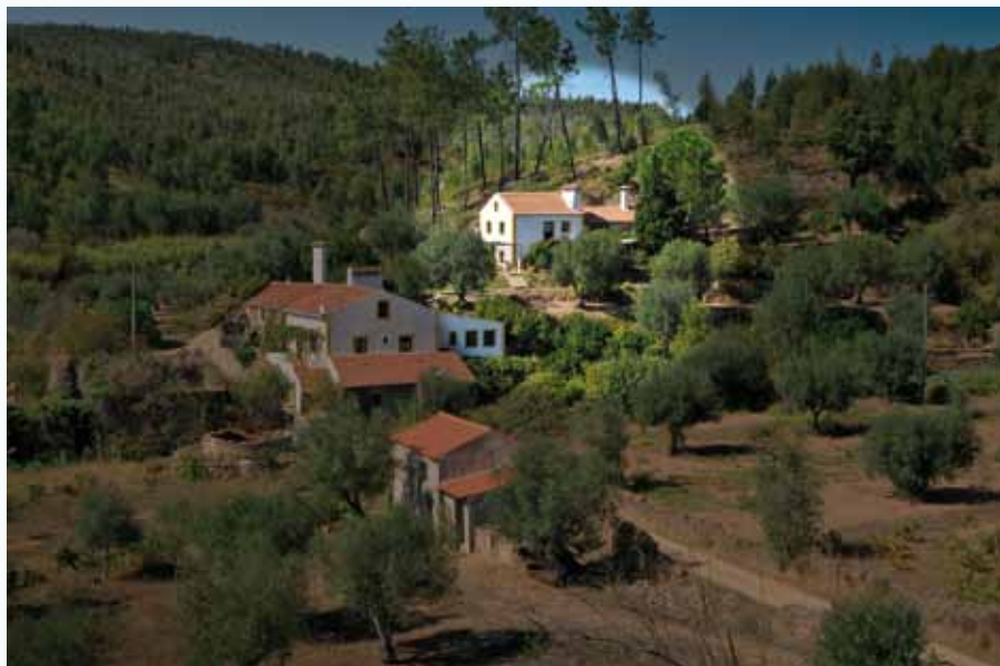
A casa que Artur Marques da Costa reabilitou no Salgueiral

(Transcrito do jornal “Público”, edição de 28 de Janeiro de 2002 - Foto por cortesia da Sociedade Portuguesa de Física. Fotografia publicada em Gazeta de Física nº 27(2), Abril de 2004)