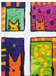
Gatos ao quadrado Khel Huot – 12 anos