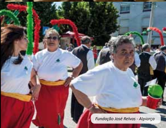
Fundação José Relvas - Alpiarça

As Marchas Populares voltaram ao Sardoal. A Tapada da Torre acolheu, no dia 18 de junho, 10 marchas e cerca de 400 marchantes, num dia e numa noite pautados pela cor, música e muita animação. A iniciativa foi da F.U.S., GETAS e G.D.R. "Os Lagartos", com o patrocínio do Município de Sardoal e o apoio das restantes Juntas de Freguesia.