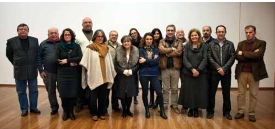
Encontro de Autores Locais

A Semana da Leitura foi promovida pelo Município, através da Biblioteca, e pelo Agrupamento de Escolas deste Concelho.