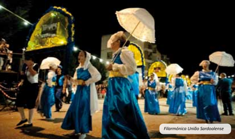
Filarmónica União Sardoalense