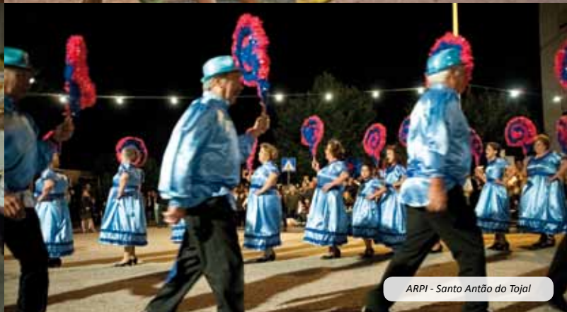
ARPI - Santo Antão do Tojal