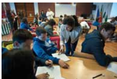
Workshop de Manga/Anime Mayhara Ferraz