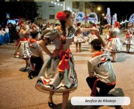
Benfica do Ribatejo

As Marchas Populares voltaram ao Sardoal. A Tapada da Torre acolheu, no dia 18 de junho, 10 marchas e cerca de 400 marchantes, num dia e numa noite pautados pela cor, música e muita animação. A iniciativa foi da F.U.S., GETAS e G.D.R. "Os Lagartos", com o patrocínio do Município de Sardoal e o apoio das restantes Juntas de Freguesia.