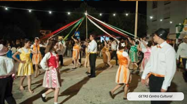
GETAS Centro Cultural