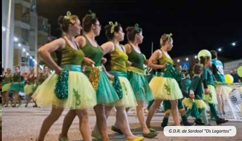
G.D.R. de Sardoal "Os Lagartos"