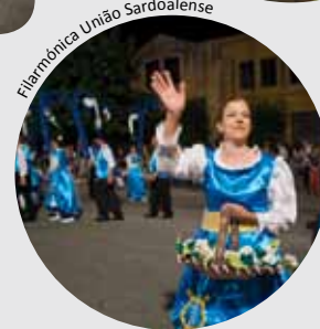
Filarmónica União Sardoalense