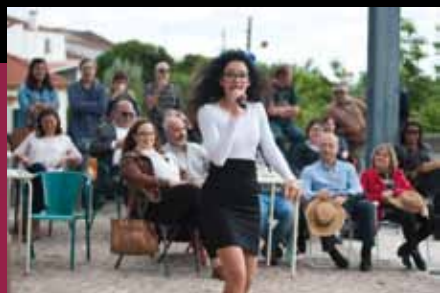
Violets are Blues Trio