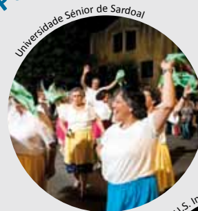
Universidade Sénior de Sardoal

Os Santos Populares foram festejados no Sardoal, à semelhança de anos anteriores, através de um desfile de Marchas Populares, que decorreu na noite de 17 de junho. A atividade, organizada pelo GETAS - Centro Cultural, Filarmónica União Sardoalense e Grupo Desportivo e Recreativo “Os Lagartos”, contou com um desfile, na Avenida Heróis do Ultramar, das marchas das associações organizadoras, da Universidade Sénior de Sardoal, e de uma marcha convidada, oriunda do Pego.