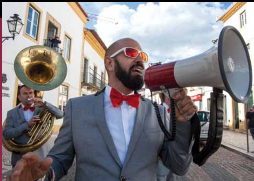
Cottas Club Jazz Band

Entre 5 e 7 de maio, as portas do Centro Cultural Gil Vicente voltaram a abrir-se para receber o Sardeal Jazz. A 3.ª edição desta iniciativa marcou-se, à semelhança das anteriores, pela elevada qualidade musical e artística, mas também por momentos de grande animação, diversão e descontração.