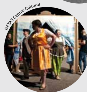
GETAS Centro Cultural