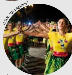
G.D.R. “Os Lagartos”