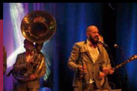
Cottas Club Jazz Band