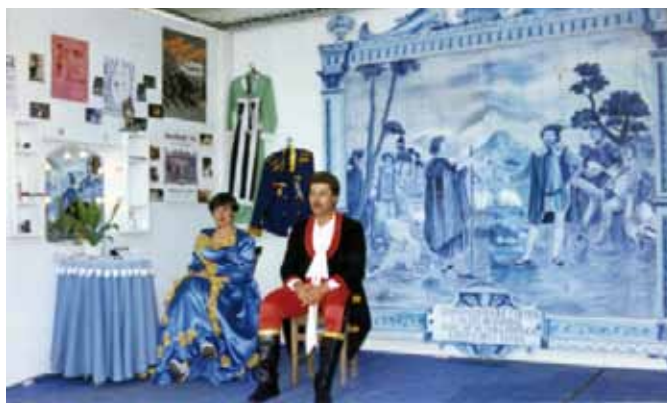
Festas do Concelho/Semana Cultural - 1987