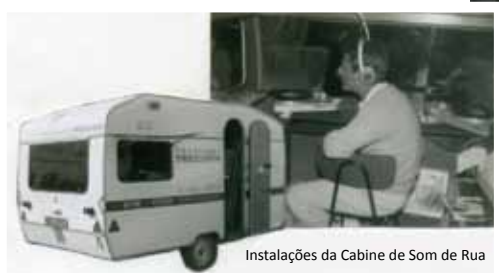
Instalações da Cabine de Som de Rua