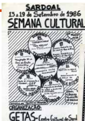
Programa da primeira Semana Cultural Reportagem pelo Boletim Cultural "Atrium"