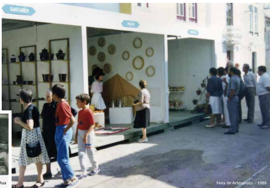
Feira de Artesanato - 1988

o voluntariado operacional, assegurando tarefas e serviços no decurso dos certames e montando outro tipo de espectáculos (de temas e envolvimento endógenos), concursos, performances de rua e soluções criativas (por exemplo, o Loto Cultural, onde em vez de números “saíam do saco” referências a monumentos, figuras ilustres, toponímia e factos históricos). Mas o GETAS também contribuía para o financiamento e programação globais das festas por via de uma agressiva e bem sucedida estratégia de apresentação de projectos e planos de actividades junto de múltiplas entidades públicas e privadas e de protocolos de permuta com agremiações congéneres e o INATEL. Dois casos: o cachet do artista Paco Bandeiram atracção em 1988, foi assumido integralmente pelo GETAS e a 1.ª Feira de Artesanato, no mesmo ano, foi possível devido a uma candidatura do grupo ao Centro de Emprego de Abrantes.