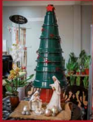
Plurifrutos PARQUE EMPRESARIAL SARDOAL