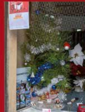
Tecedeira à Moda Antiga SARDOAL