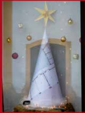
Modo, Arquitetos Associados, Lda SARDOAL