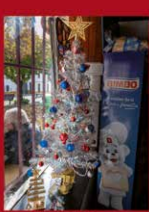
Café Ponto de Encontro VALHASCOS