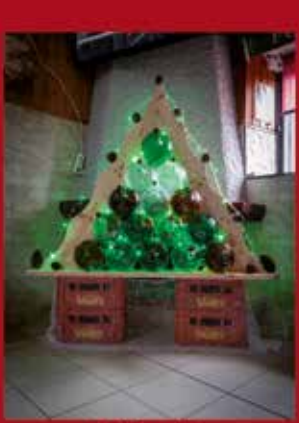
Café Espanhol ALCARAVELA