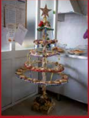
Cooperativa Artelinho ALCARAVELA