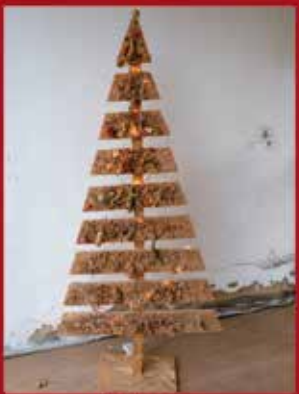
Medida Larga PARQUE EMPRESARIAL SARDOAL