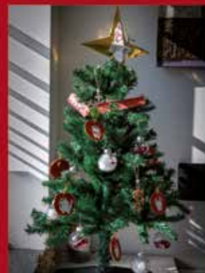
Clinica Médica Dentária André Rodrigues, Lda | SARDOAL