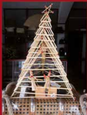
Dias Sport SARDOAL