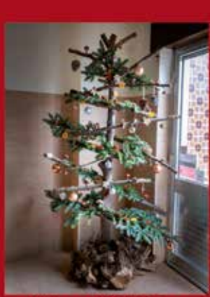
Minimercado/Café da Gema CABECA DAS MÓS