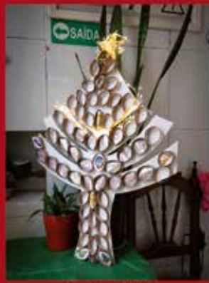
Lurdes Esteticista SARDOAL