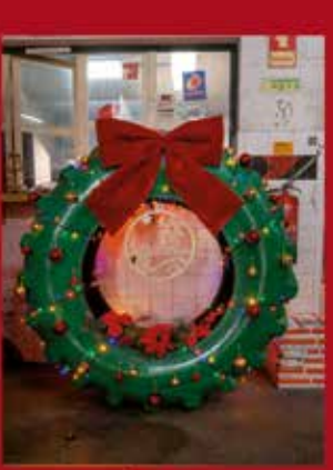
Sarpneus PARQUE EMPRESARIAL SARDOAL