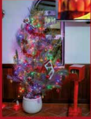
Residencial Gil Vicente SARDOAL