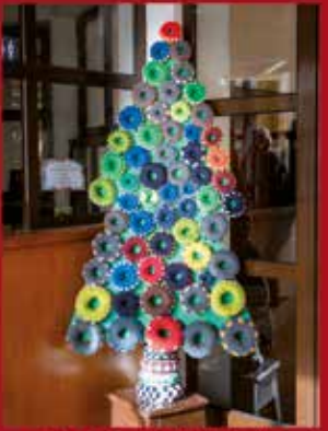
Santa Casa da Misericórdia de Sardoal