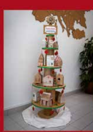
Agrupamento de Escolas SARDOAL