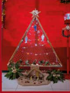
O Sardinha SARDOAL