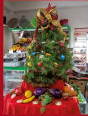
Minimercado Rosa Teimão ANDREUS