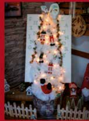
Shining Laundry Lavandaria Self-Service I SARDOAL