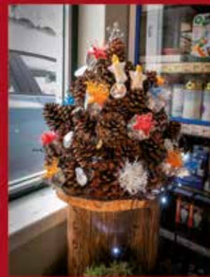
Loja D'Aldeia ALCARAVELA