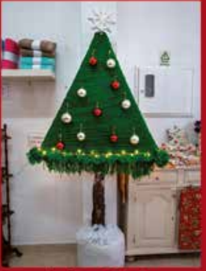
Ana Decor Confeções SARDOAL