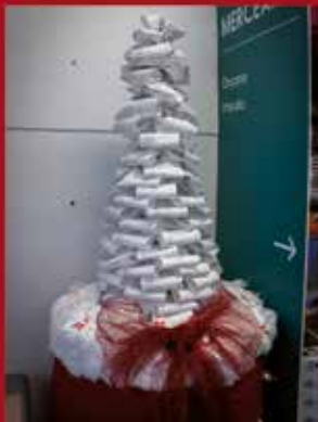
Supermercado Meu Super SARDOAL