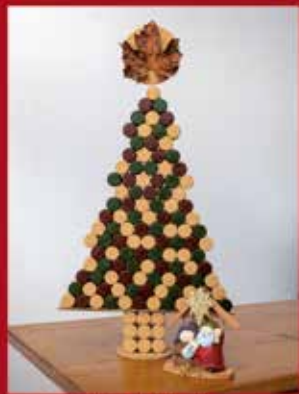
Quinta Vale do Armo ENTREVINHAS