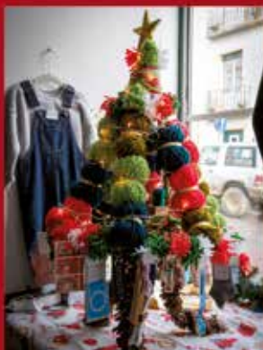
Cantinho by Luzia SARDOAL