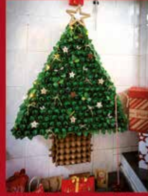
O Pelourinho - Restaurante e Petiscaria SARDOAL