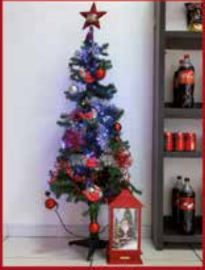
Sardoal Grill SARDOAL