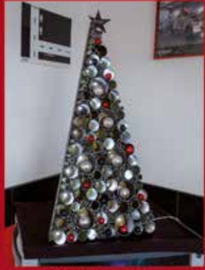
GSP Unipessoal, Lda PARQUE EMPRESARIAL SARDOAL