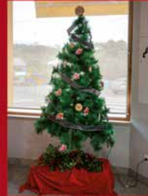
Cacris - Café Snack Bar SARDOAL

Todas as Árvores que estiveram a concurso puderam ser apreciadas na exposição que esteve patente, em dezembro, junto ao Posto de Turismo.