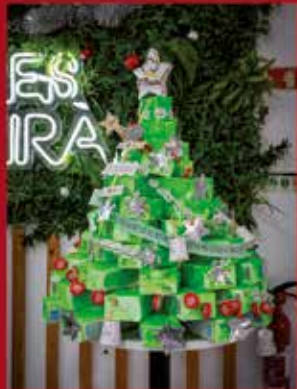
Pastelaria/Padaria Sabores do TI Pereira I SARDOAL