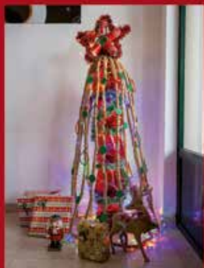
Café/Snack Bar El Gran Eucalipto SARDOAL