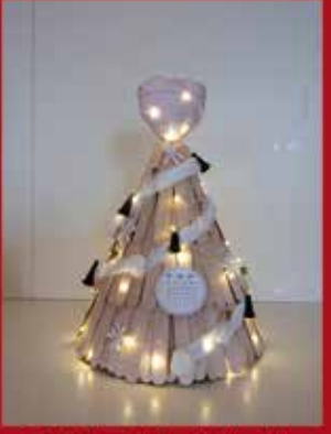
Sarclínica - Clínica Médica, Lda SARDOAL