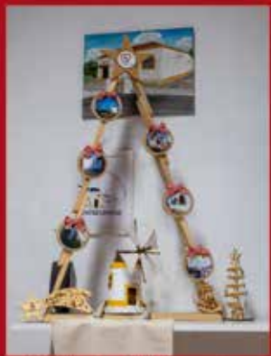
Associação de Melhoramentos dos Amigos de Entrevinhas