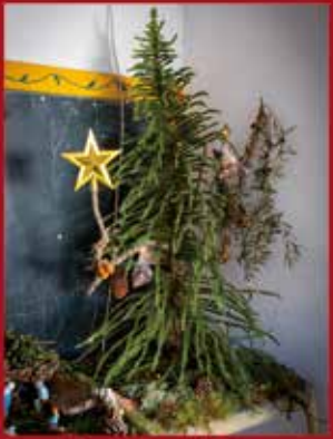
Associação de Amigos de Santiaao de Montaleare