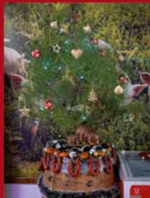
Talho da Aizira SARDOAL