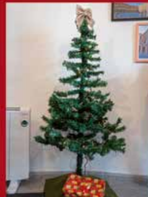
Clip Seguros SARDOAL