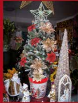
Florista Detrás da Fonte SARDOAL