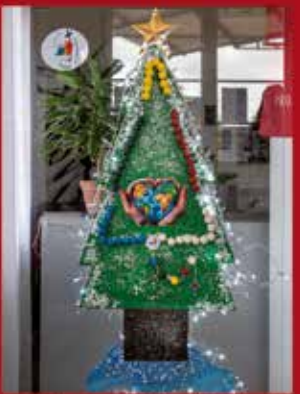
Associação de Assistência e Domiciliária de Alcaravela